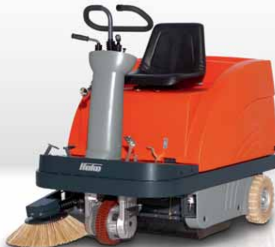
Sweepmaster B900 R