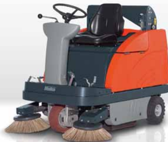
Sweepmaster B980 RH