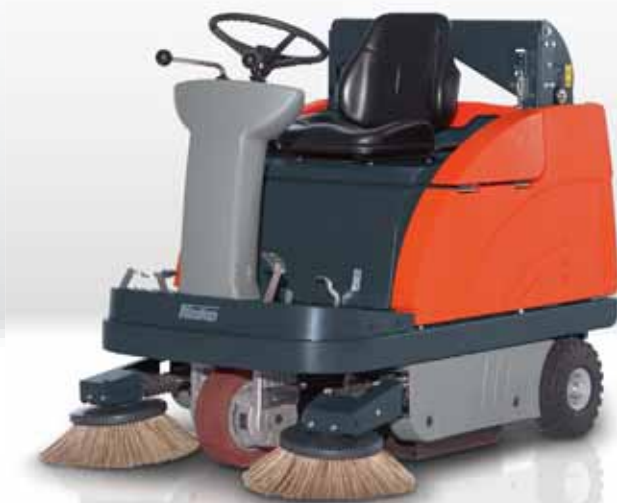
Sweepmaster B980 RH