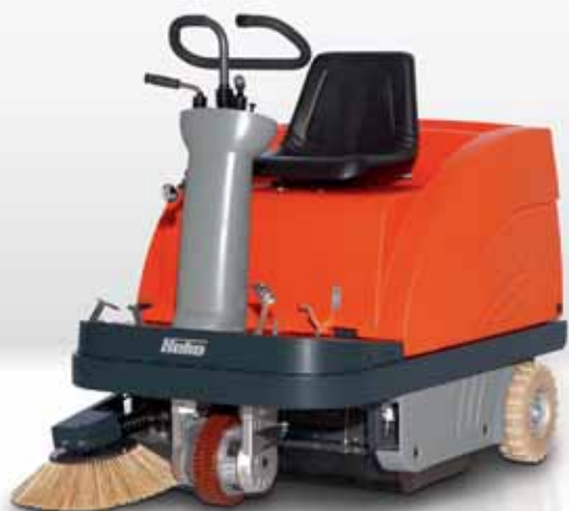
Sweepmaster B900 R